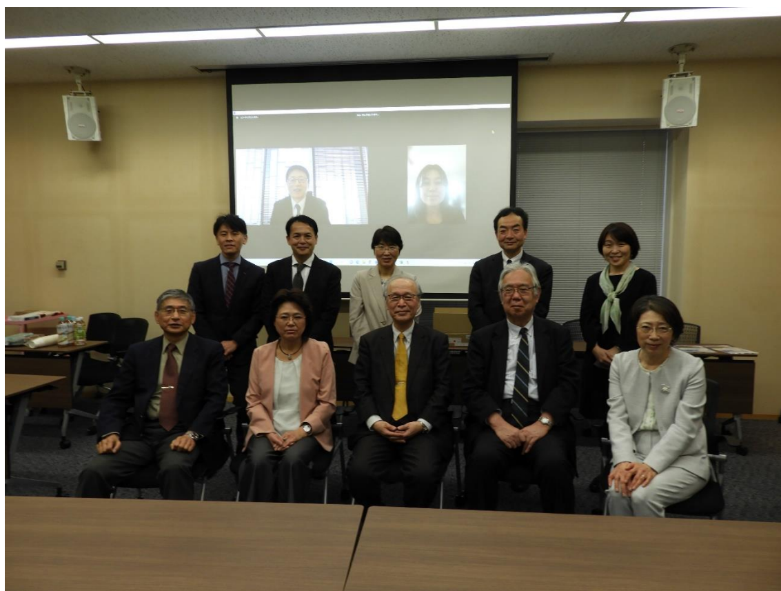
2023 年 3 月 20 日第 1 回理事会記念撮影